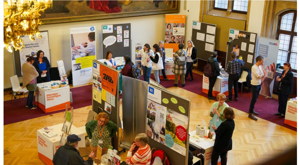
Fotos: Aussteller-Stände der FreiwilligenMesse 2024